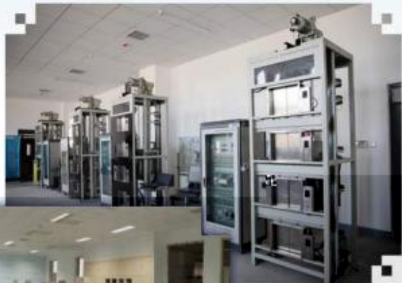
智能电梯安装调试维护训练场所