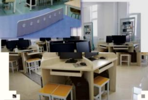
一体化课程教学设计综合实训室