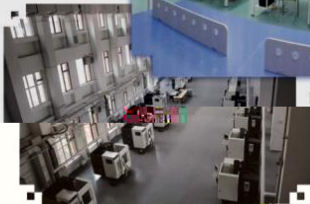
DMG 数控技术训练场所